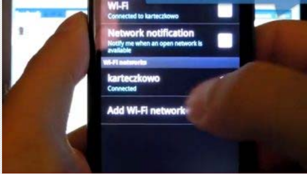
FaceNiff: Spionage-App für Android